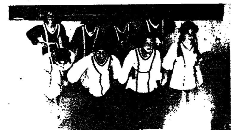
لقطة لفرقة أثناء التدريب

بعد تكدي من ان الفرقة تستطيع الظهور أمام الجمهور، وبعد دعوة تقيتها، اشتركت الفرقة في قرية المكر في الجليل اقيم في قرية المكر في الجليل الغربي، وقدمت فرقتنا وصلات خاصة، حازت على استحسان الجمهور، واللجنة الخاصة، وكانت الجائزة الرمزية التي